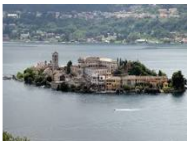
Ile de San Giulio