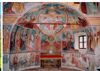
L'église de Momo