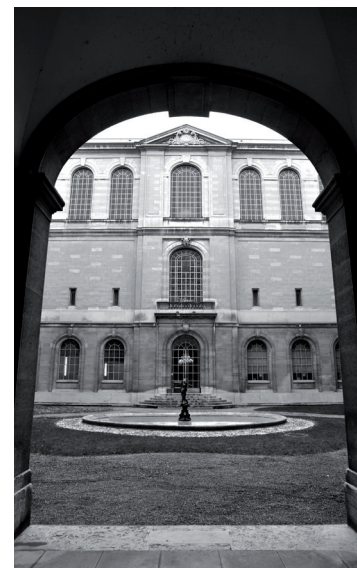
La cour-cloître du Musée d'art et d'histoire de Genève.